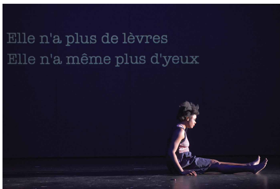
Harlem Quartet

→ Décrire le plus complètement possible les utilisations de la musique et identifier ses fonctions. Réfléchir aussi bien à la musique qui appartient à la fiction qu'à celle qui n'est pas produite par les personnages, ainsi qu'à la présence des musiciens sur le plateau. Écouter ces extraits audio mis à disposition par la compagnie, en particulier les extraits 1 et 4 ( https://soundcloud.com/user-535566539 ). Pour se remémorer l'univers musical des Trompettes de Sion, préparer une présentation du morceau Take me to the water chanté par Nina Simone : https://www.youtube.com/watch?v=If6i59NUfkk