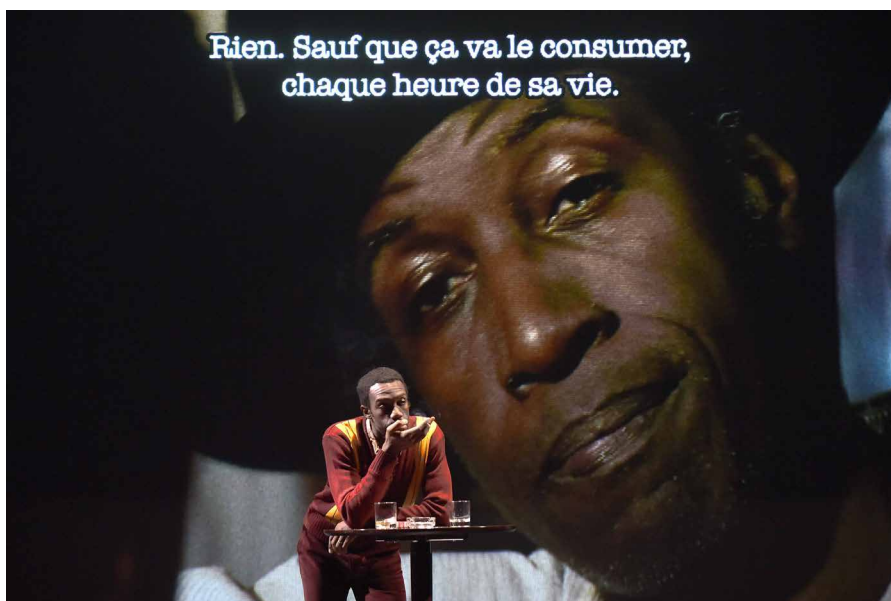
Harlem Quartet

La lumière joue de façon diverse dans ce dispositif. Elle a deux sources essentielles. D'abord, les projecteurs qui peuvent produire un éclairage homogène dans certaines scènes (par exemple dans l'appartement de Julia en 1958) ou créer des effets de clair-obscur ou encore sculpter l'espace en profondeur et jouer entre les panneaux mobiles (beaucoup de scènes sont éclairées par des faisceaux latéraux). Les projections vidéo contribuent à éclairer le spectacle et dessinent ou suggèrent, elles aussi, les espaces de la fiction.