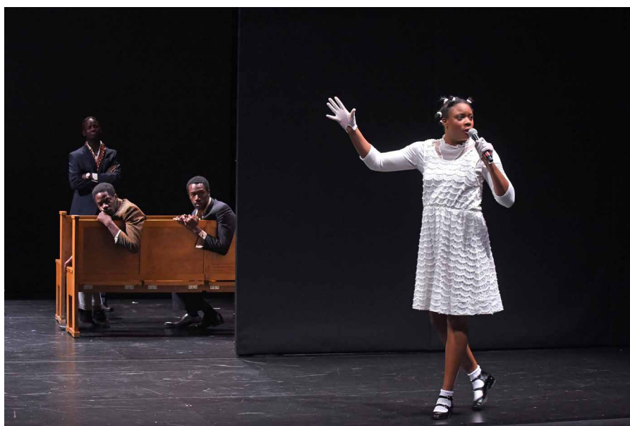
Harlem Quartet

Rien n'est moral. Tout donne à penser. Surtout l'amour. La façon qu'on a de s'aimer, soi-même et les autres. Mais aussi le rapport au temps. Le destin et le hasard et le fascinant jeu de la mémoire qui tente inlassablement de ne rien perdre. De comprendre.