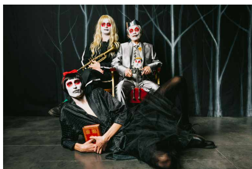
Blanche-Neige, histoire d'un Prince ©Venkat Damara