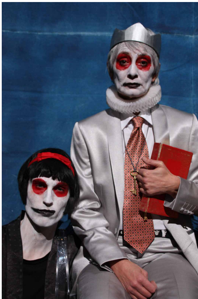
Blanche-Neige, histoire d'un Prince

En effet, dans une précieuse reconsidération des enjeux et du Conte et du Monde, Marie Dilasser déplace par exemple le sort funeste accordé à la pomme ingurgitée par l'héroïne : si de poison il doit s'agir, n'est-ce pas plutôt celui d'un environnement désormais voué à la pollution ambiante et généralisée ?