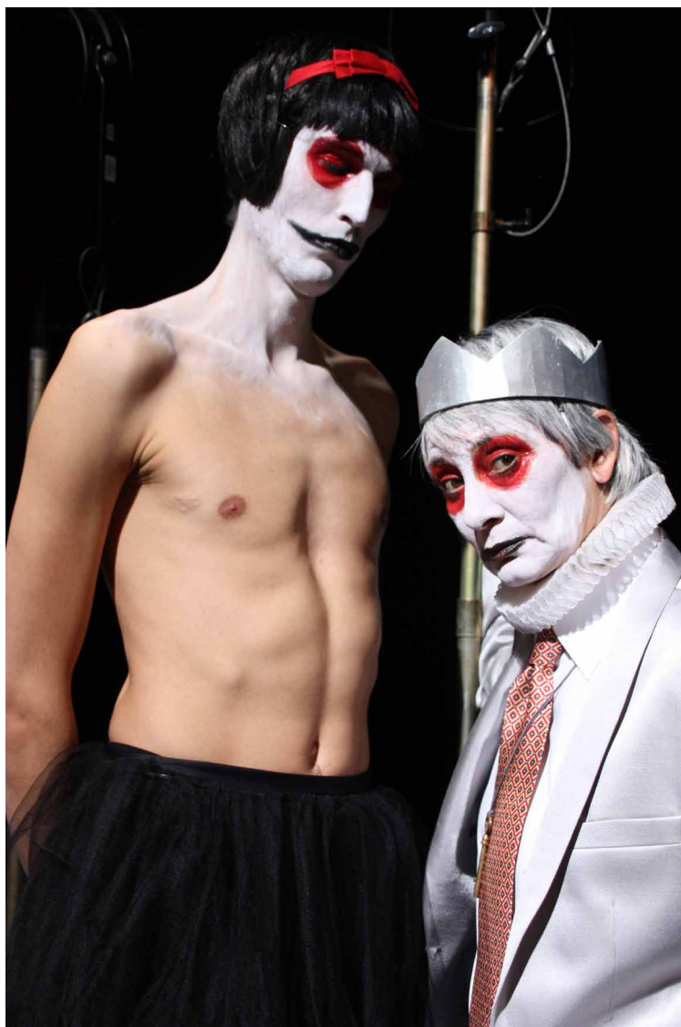
Blanche-Neige, histoire d'un Prince

Le conte traditionnel fait appel à une multitude d'objets. Il convient de demander aux élèves de relever ces objets : la pomme, le miroir, le cercueil en verre... et de les projeter dans leur mise en scène. Et enfin, prévoir une observation de ces objets lors du spectacle.