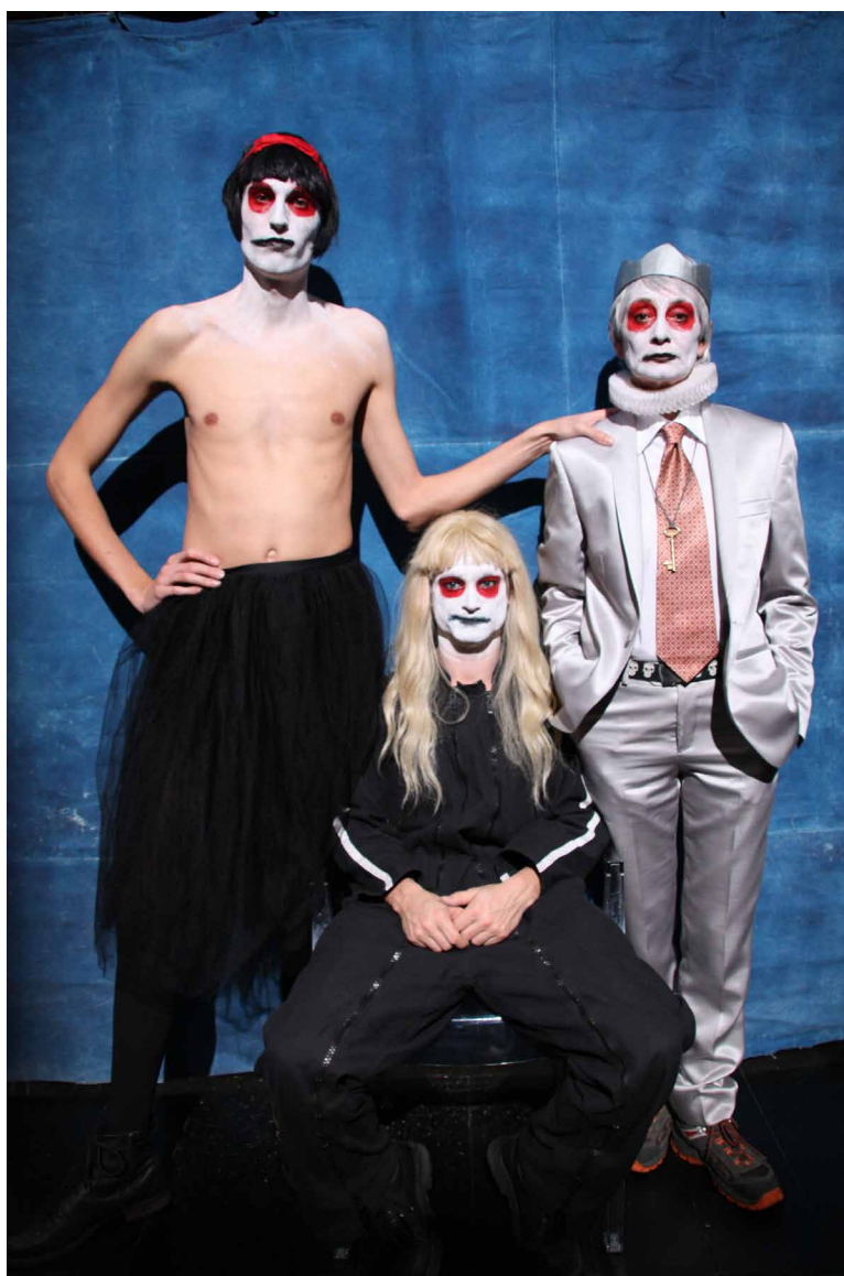
Blanche-Neige, histoire d'un Prince ©Julien Louisgrand

Sur cette lettre mes doigts ont trébuché. Blanche-Neige. Vos doigts sont bleus Le Prince. Et mon cœur si tu savais comme il trébuché. Mon sang ne fait qu'un tour. Blanche-Neige. Doigts bleus, ventre bleu, jambes, cœur et sang bleus ! Ne vous inquiétez pas, je serai toujours à vos côtés pour mélanger mes doigts aux vôtres, mon ventre à votre ventre, mes jambes, mon cœur et mon sang aux vôtres.