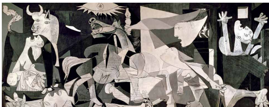
Guernica, Pablo Picasso, 1936

Langue Vivante Espagnole : analyse de tableau de Pablo Picasso : Guernica , 1936